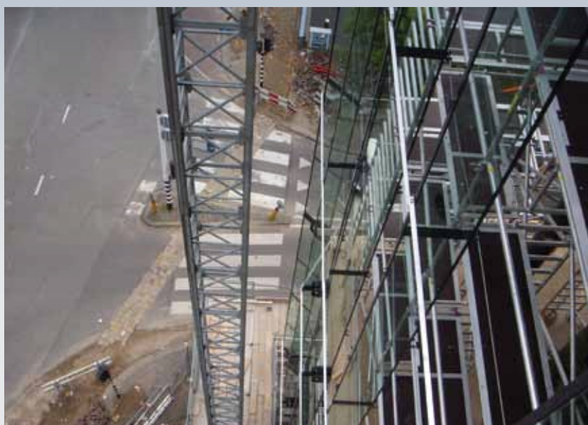
Tijdens aanbrengen van glasplaten