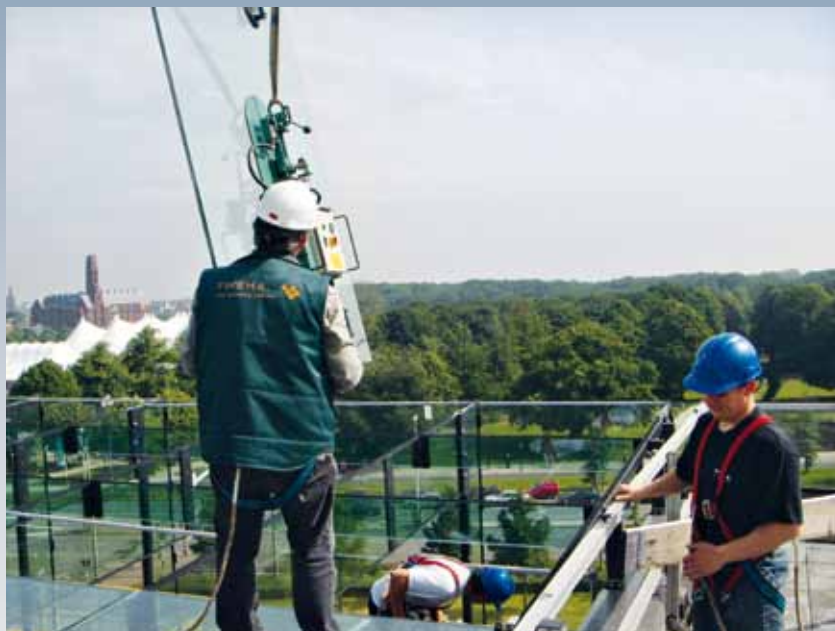
Bij het bevestigen van de glasvinnen voor het dakvlak

De 21 meter hoge vinnen achter de glasgevels bestaan uit een tweelaagse, geharde beglazing. Die onder de dakconstructie zijn korter en bestaan uit drielaags glas. Daar spelen andere belastingen. De lijmruil aan alle zijden is slechts 5 mm dik. Het stalen frame op de lange zijden bestaat uit dunne massieve strips. Aan de boven- en onderzijde zijn zwaardere strips aangebracht, waarin een klauwverbinding is uitgespaard. Door de strips contra te plaatsen, grijpen de vinnen in elkaar. Een aantal boutverbindingen zekeren de bevestiging. De gevelplaten worden vastgeklemd door roestvast stalen plaatjes met daarachter een EPDM-drukschijf. De plaatjes zijn naar wens van de architect 900 mm hart-op-hart met twee bouten bevestigd in een voorziening op de kopse kant van de vin. De verticale en horizontale naden tussen de glasplaten en de ruimte tussen glasplaten en vinnen is afgedicht met een structurele kit op dezelfde basis als de lijm. Een dusdanige verlijming van glas op staal is voor Nederland een primeur. Alleen mogelijk door gedegen en minutieus onderzoek en door een constructieve lijm te ontwikkelen, geschikt voor deze specifieke toepassing.