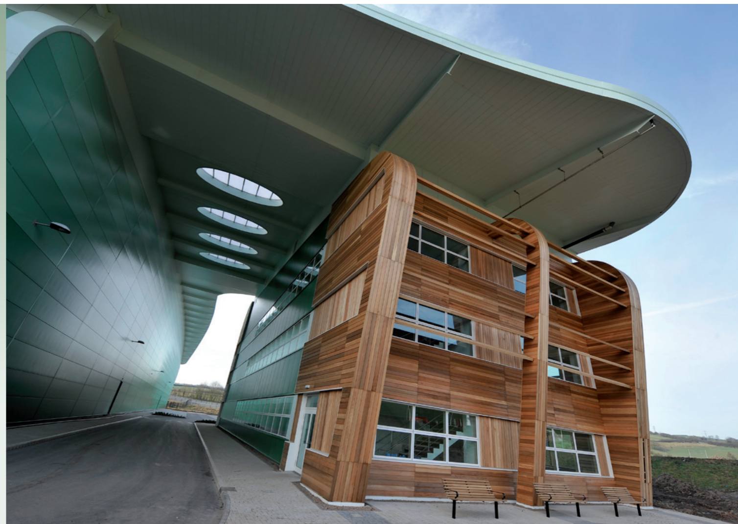
De ontwerpers van Gazeley zetten de kantoren los van de loods

kers is de BREEAM Outstanding Rating het hoogst haalbare: 'Het BREEAM-label betreft bij het oordeel alle facetten die bij duurzaamheid een rol spelen. Ook bijvoorbeeld de bereikbaarheid van het gebouw beïnvloedt de hoogte van de waardering. Is er op de locatie openbaar vervoer aanwezig, of ben je als werknemer aangewezen op het gebruik van de auto? Het BREEAM-label geeft een optelsom van al die zaken die bijdragen aan een schonere-, zuiniger- en uiteindelijk beter gebouw.'