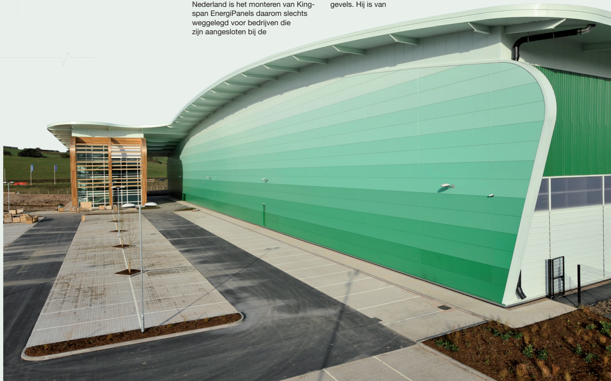
Ook expressieve vormen en kleuren zijn in Kingspan-panelen mogelijk

mening dat daar 'veel te veel handjes' bij komen kijken. 'Natuurlijk, bouwen blijft hoe dan ook mensenwerk. Ook voor het monteren van Kingspan Energiepanelen zijn handjes nodig. Maar het werk op de bouwplaats is door Kingspan wel geminimaliseerd. Want, hoe meer handelingen er op de bouwplaats moeten plaatsvinden, hoe groter de kans is op fouten. Elke bouwster zal zich hierin kunnen vinden.'