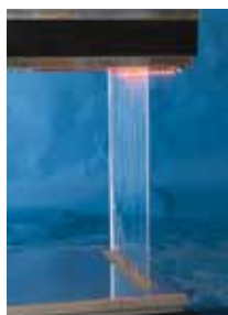
De kleur van de watergevel is aan te passen aan elke gewenste gemoedstoestand