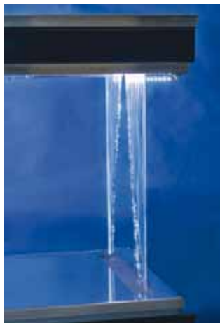
Het water 'opent' zich, waardoor een entree ontstaat